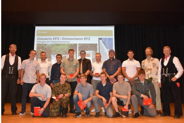
Eine Klasse der erfolgreichen Absolventen Zimmermann EFZ